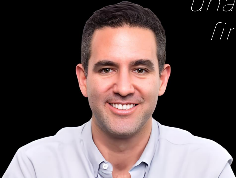
David Vélez CEO Nubank

“Lo que queríamos hacer en Nubank es ser una empresa de tecnología que se dedica a los servicios financieros. No somos una empresa de servicios financieros que utiliza tecnología”